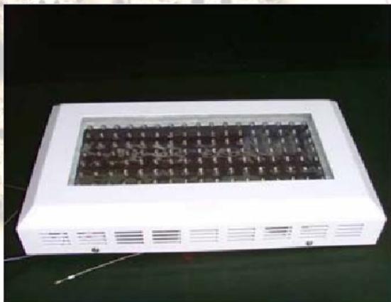
Přední strana světla