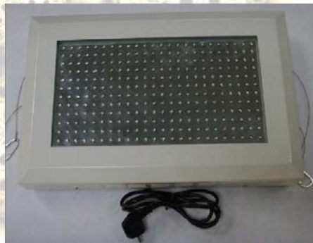
Přední strana světla